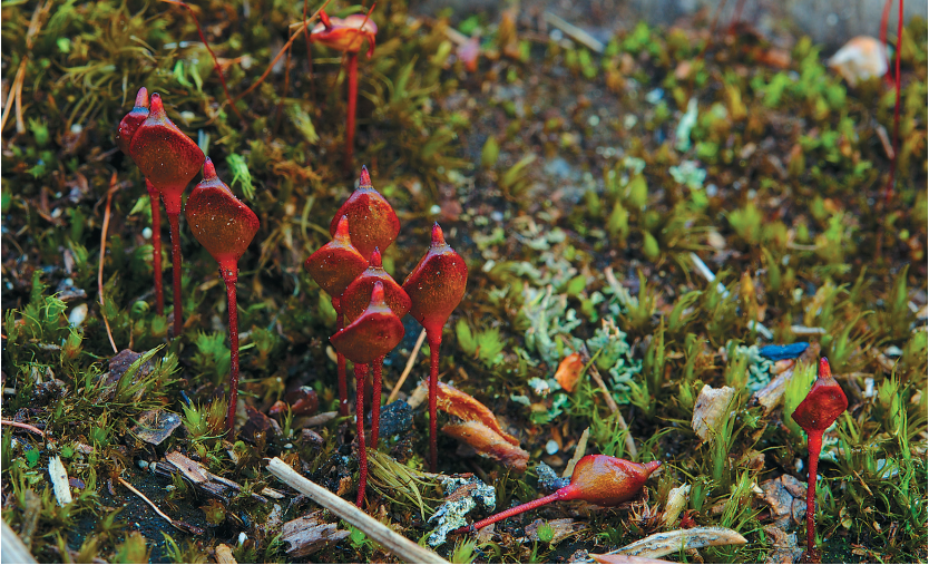
Рис. 3. Спорофиты буксбаумии безлистной ( Vixbaumia aphylla ) на туристической стоянке в среднем течении р. Умба, на утоптанной почве.