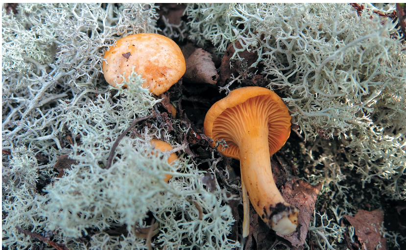
Рис. 2. Лисичка настоящая ( Cantharellus cibarius ) на территории памятника природы регионального значения «Водопад на реке Чаваньга».