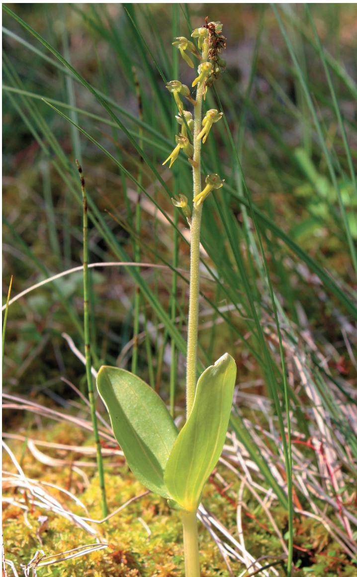
Рис. 10. Тайник яйцевидный ( Listera ovata ) на запа-болоте с облесенными грядами, обводненными мочажинами и протокой в окрестностях г. Апатиты.