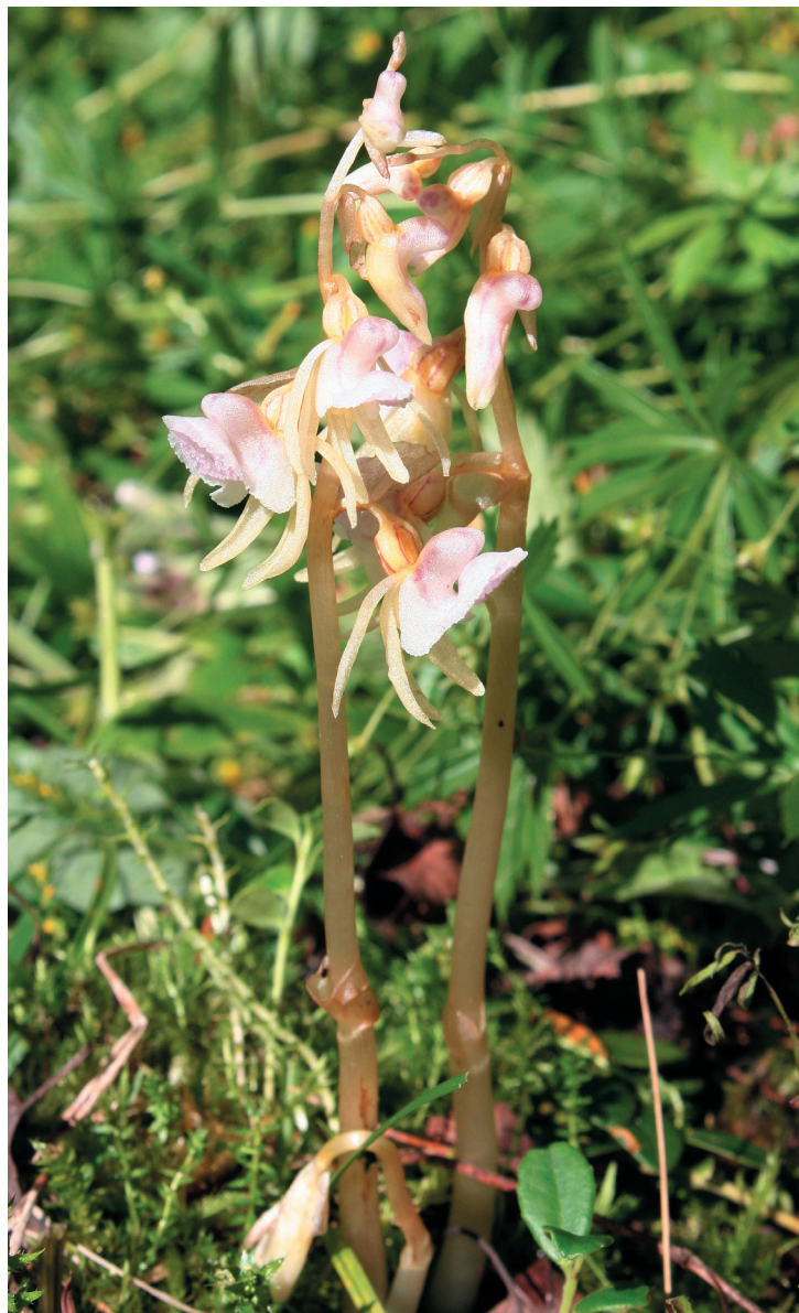
Рис. 9. Надбородник безлистный ( Epirogium aphyllum ) в 3 км к югу от п. Октябрьский, оз. Щучье.