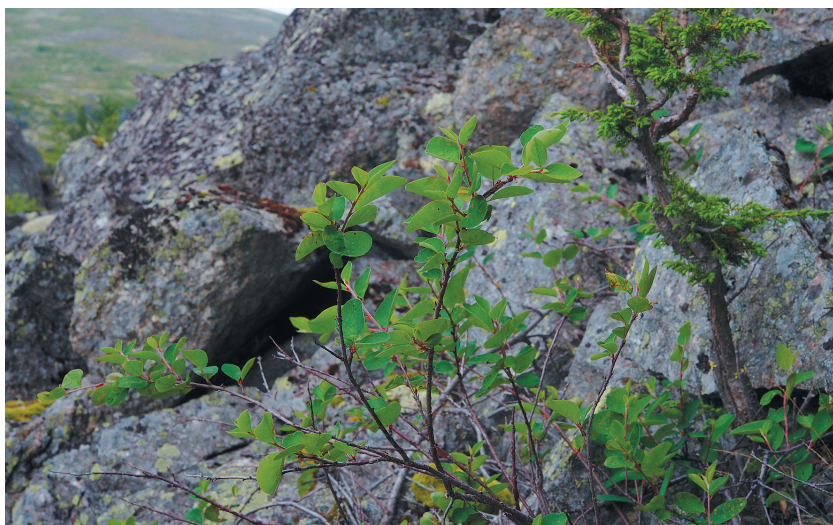
Рис. 13. Кизильник киноварно-красный ( Cotoneaster cinnabarinus ) на территории памятника природы регионального значения «Айкуайвенчорр».