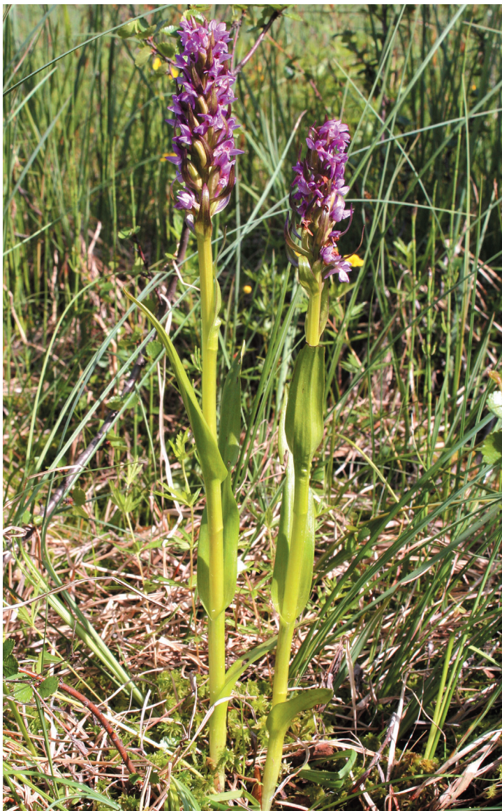
Рис. 11. Пальчатокоренник мясо-красный ( Dactylorhiza incarnata ) на аапа-болоте с облесенными грядами, обводненными мочажинами в окрестностях г. Апатиты.