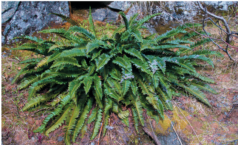
Рис. 5. Многорядник копьевидный ( Polystichum lonchitis ) на территории памятника природы регионального значения «Айкуайвенчорр».