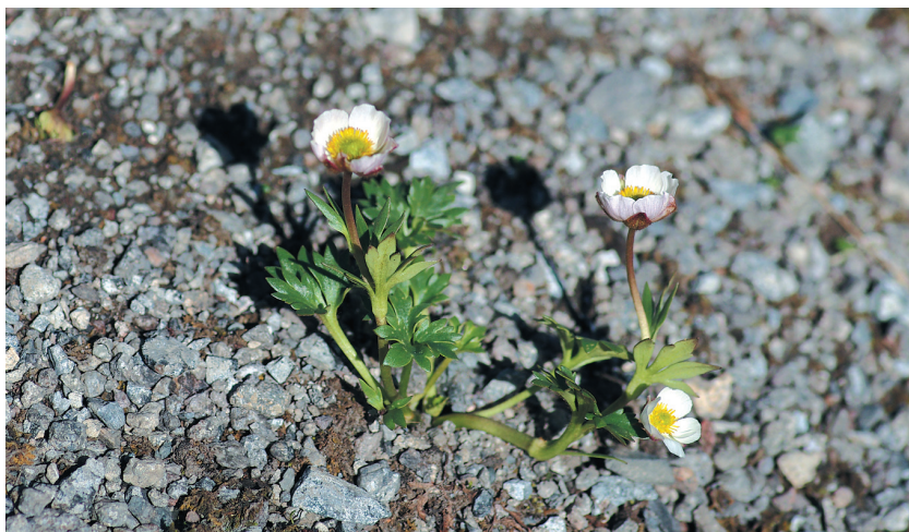
Рис. 12. Беквичия ледниковая ( Beckwithia glacialis ) на территории памятника природы регионального значения «Юкспорлак».