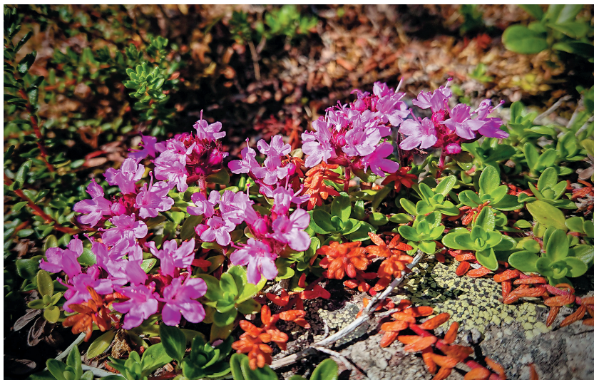
Рис. 7. Тимьян субарктический ( Thymus subarcticus ) на п-ове Рыбачий.