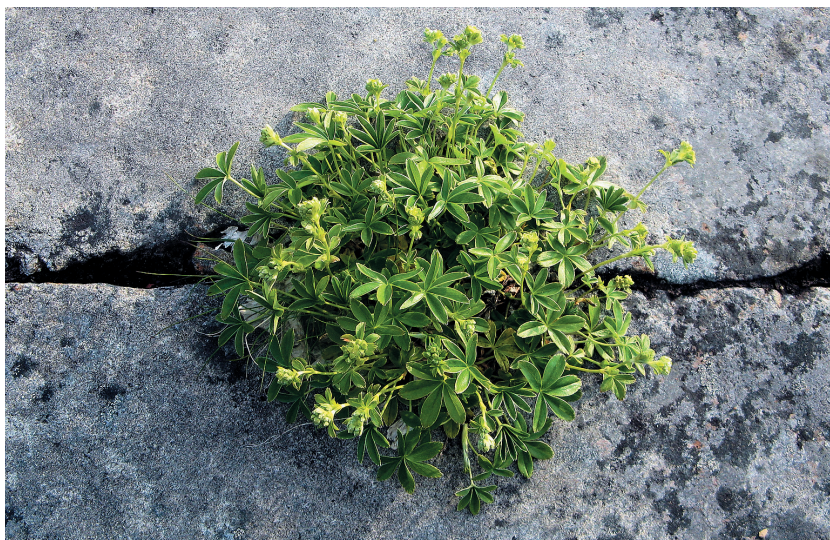
Рис. 6. Манжетка альпийская ( Alchemilla alpina ) на п-ове Рыбачий.