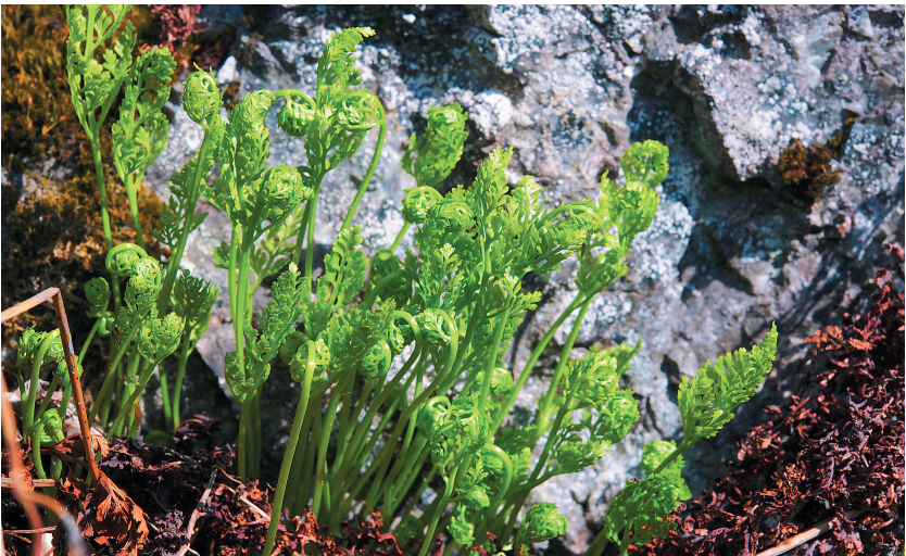
Рис. 4. Криптограмма курчавая ( Cryptogramma crispum ) на территории памятника природы регионального значения «Криптограммовое ущелье».