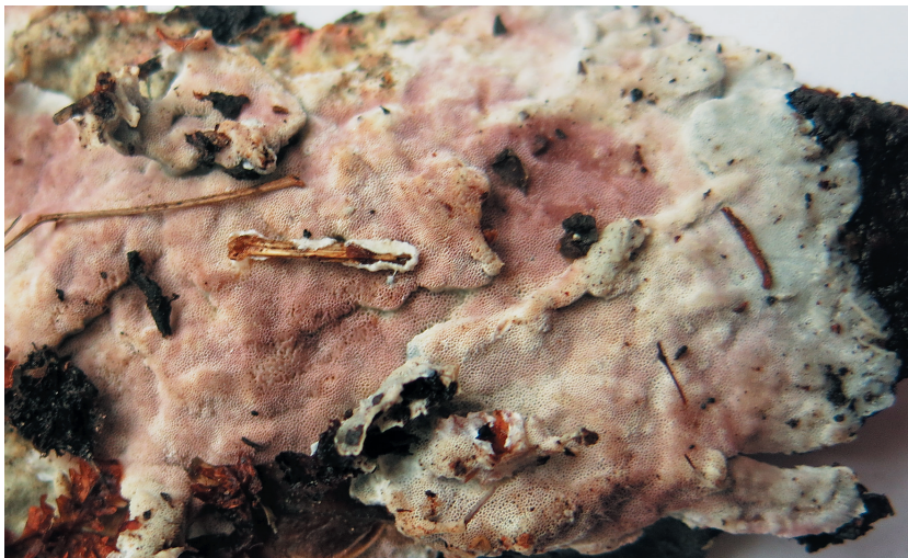
Рис. 1. Скелетокутис лиловый ( Skeletocutis lilacina ) на поваленном стволе ели на берегу р. Канда.